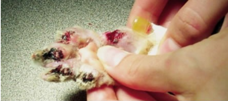
Complicaciones en una desungulación